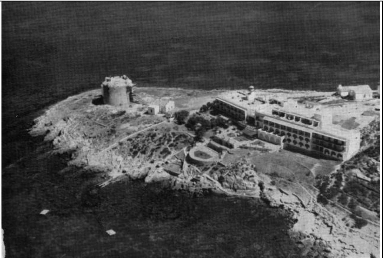
Veduta aerea dell'albergo (foto d'epoca)