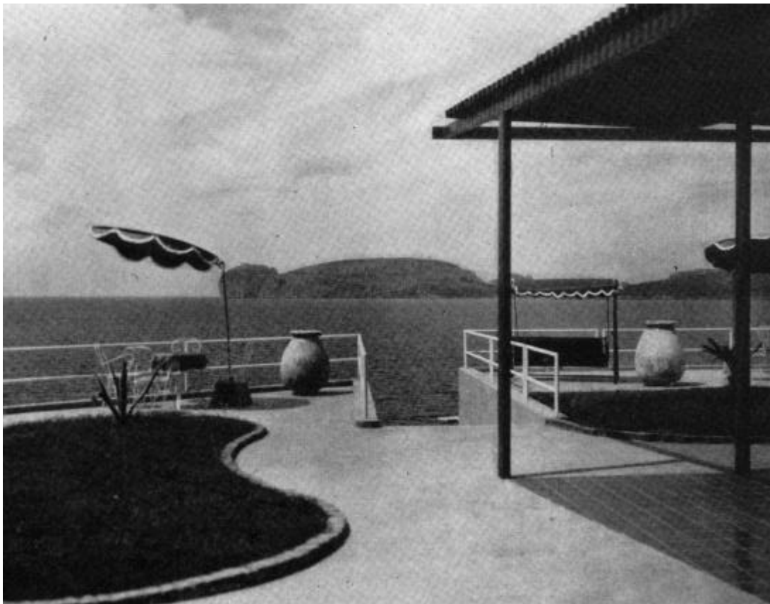
Veduta della terrazza in una foto d'epoca