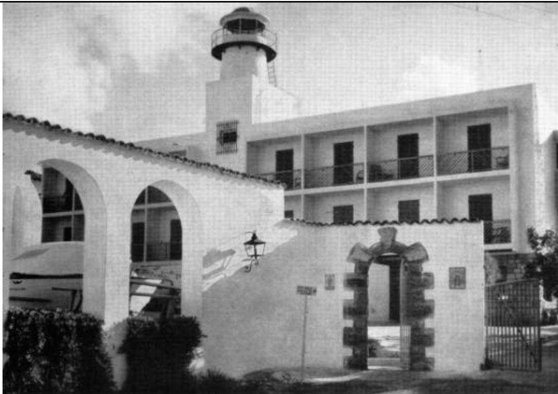
Veduta dell'ingresso in una foto d'epoca