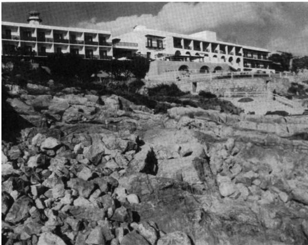
Veduta dell'albergo dalla scogliera (foto d'epoca)